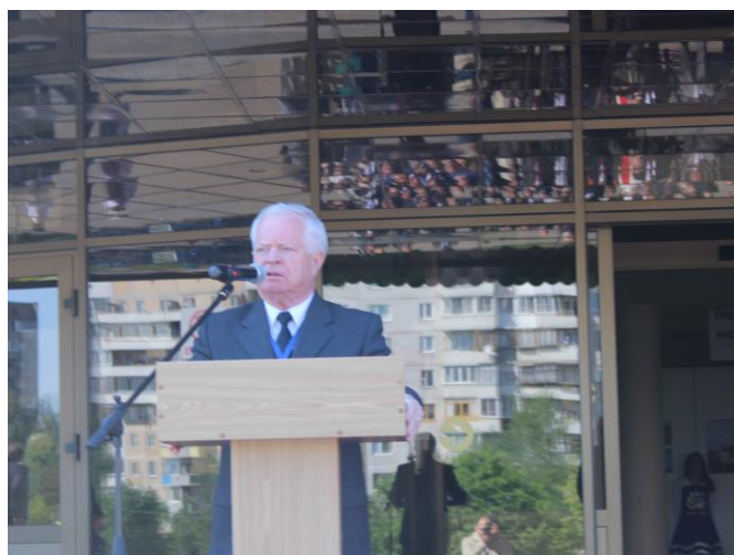
Йозеф Мигаш – чрезвычайный и полномочный посол Словацкой Республики в Республике Беларусь

С приветственным словом на открытии форума выступил: Господин Йозеф Мигаш – чрезвычайный и полномочный посол Словацкой Республики в Республике Беларусь