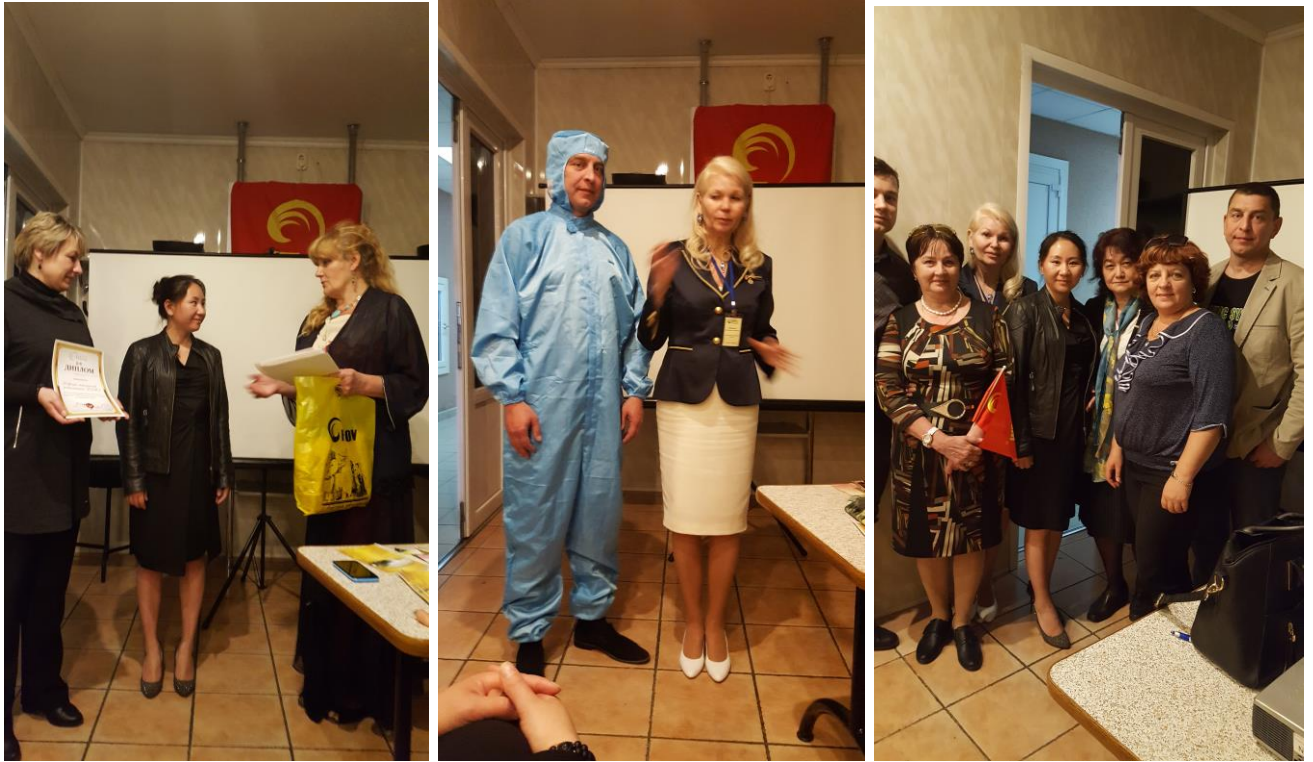
Семинар-практикум - совместный проект НИИ оздоровительного питания ЯН-ШЕН (Китай) и кафедры медицинской реабилитации ВМГУ

В рамках Форума прошли специализированные выставки "Инвестиционный потенциал Витебской области": "Инновационные энерго-ресурсосберегающие технологии, оборудование и материалы", "Стройиндустрия. Инновации в строительстве" и выставки: "Пищевая продукция Витебщины" (с дегустацией), "Перспективы развития легкой промышленности". К V Международному экономическому форуму «Инновации. Инвестиции. Перспективы» издан каталог "Инвестиционный потенциал Витебской области" где представлены инновационные и инвестиционные проекты предприятий Витебской области. Каталог распространен среди гостей и участников мероприятия.