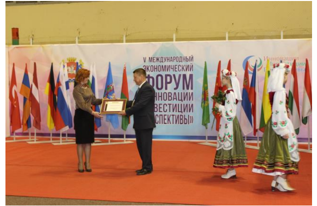
Церемония награждения лауреатов конкурса

С целью укрепления взаимовыгодного сотрудничества в социально-экономической сфере на форуме было подписано ряд международных соглашений о взаимном сотрудничестве: