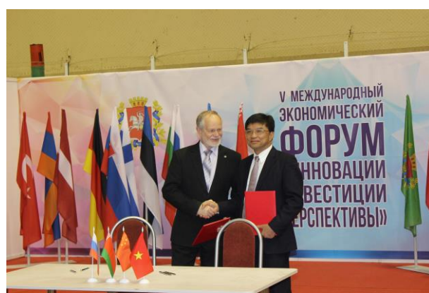
Подписание соглашений на форуме

В рамках деловой программы одним из самых важных событий форума является Международная научно-практическая конференция «Энергоресурсосбережение-2016».