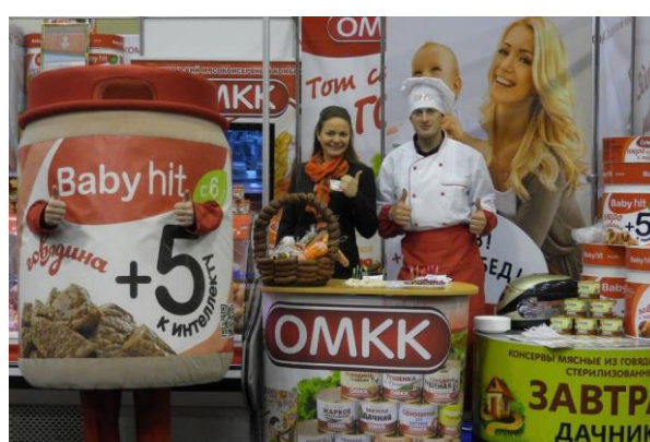
На выставочных экспозициях

Контактно-кооперационная биржа дала возможность инвесторам и потребителям ознакомиться с инвестиционными проектами, продукцией и услугами предприятий Витебского региона. В процессе работы на Форуме и встречного общения пришли к соглашению о долгосрочном и взаимовыгодном сотрудничестве: