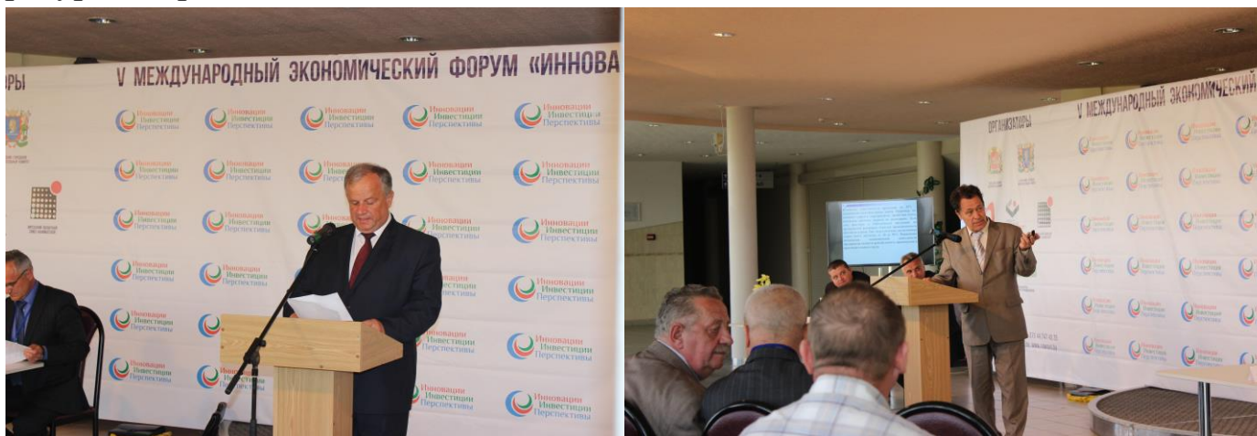
Работа конференции «Энергоресурсосбережение – 2016»

В конференции приняли участие руководители предприятий, энергетики, ведущие эксперты, научные сотрудники Республики Беларусь, Российской Федерации, Чехии. Участники конференции обсудили вопросы повышения надежности энергоснабжения и вопросы энергосбережения, ознакомились с новейшими технологиями в сфере энерго и ресурсосбережения.