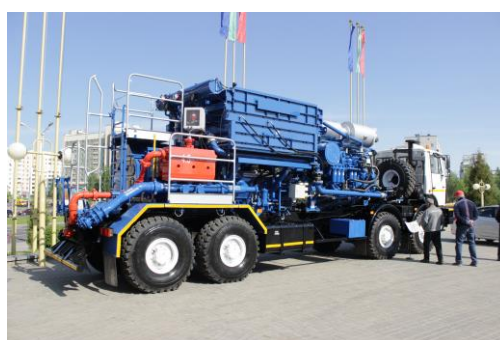
Демонстрирование председателю Витебского облисполкома сельскохозяйственной техники и оборудования

Выставка с проведением дегустации «Пищевая индустрия Витебщины» привлекла большое количество посетителей и участников Форума. В рамках выставки состоялась дегустация продукции крупнейших предприятий пищевой отрасли Витебщины: КУП "Витебский кондитерский комбинат "Витьба", ОАО "Верхнедвинский маслосырзавод", ОАО "Оршанский мясоконсервный комбинат" ОАО «Оршасырзавод», ОАО «Витебская бройлерная птицефабрика» и др.